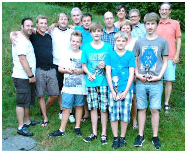
Das sind die diesjährigen Vereinsmeister der Abteilung Tennis des TuS Mettenheim, die angesichts ihres Titels allen Grund zur Freude haben.

Den sportlichen Duellen schloss sich ein gut besuchtes Grillfest an, bei dem die besten Tennisspieler mit Pokalen und Gutscheinen geehrt wurden. Text und Bild: Christiane Kretschko