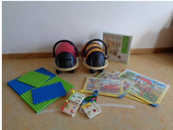
Spielmaterial für die Kinderkrippe