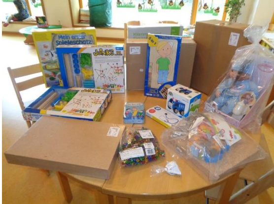
Spielmaterial für den Kindergarten

Die Einnahmen des Elternbeirats der Kinderwelt St. Michael aus vergangenen Festen ermöglichten dem Kindergartenteam den Einkauf von Spielmaterial im Wert von 820,04 €.