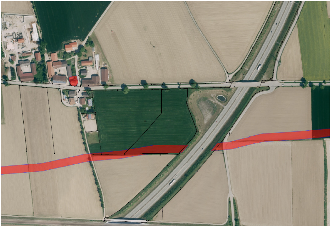
Lage der Bodendenkmäler im Ortsteil Neufahrn

Am südlichen Ende der Fläche der neu zu errichtenden PV-Anlage FlurNr. 1559 der Gemarkung Mettenheim ist ein Bodendenkmal ausgewiesen.